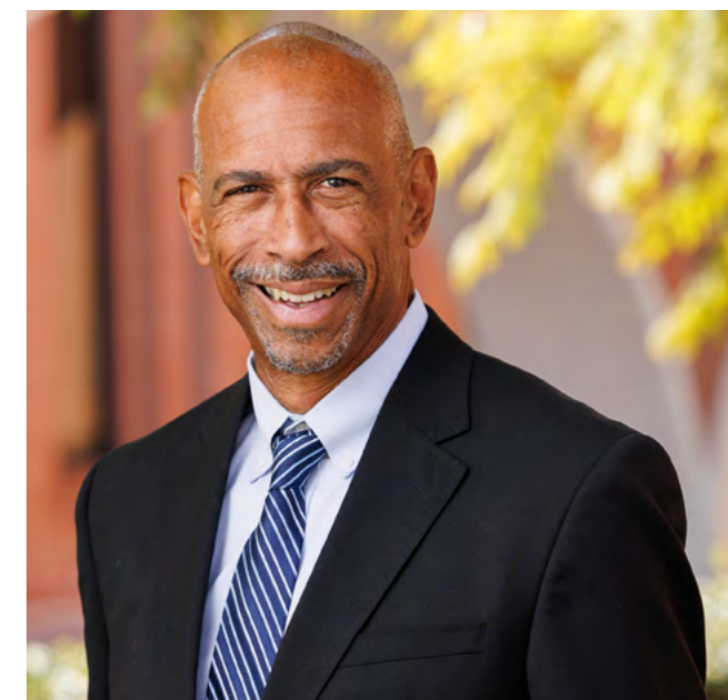
Pedro Noguera, decano de la Escuela de Educación USC Rossier (Los Ángeles, California)

“¡Un profesor puede cambiar tantas vidas! Imagínense cuando toda una escuela o liceo se organiza alrededor de profesores que tienen el mismo nivel de compromiso que en su momento tuvo Jaime Escalante. Por eso es crucial el liderazgo compartido; si hay una visión en