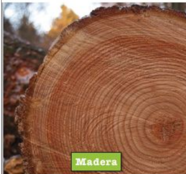
Diferentes materiales Materiales flexibles e impermeables