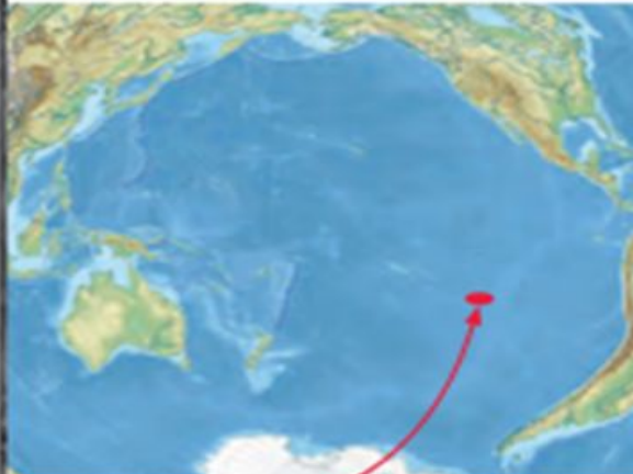
Localización de Rapa Nui en el océano Pacífico.