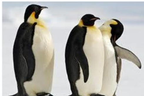
Pingüinos de Humboldt

Un funcionario del acuario dijo que el ave podría haber saltado por encima de un muro. (108)