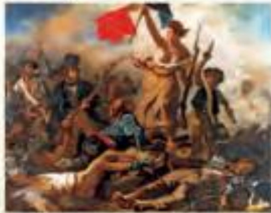
↑ Delacroix, Eugène (1839). La Libertad guiando al pueblo . [Pintura]

Derechos de primera generación o relativos a la libertad (derechos civiles y políticos)