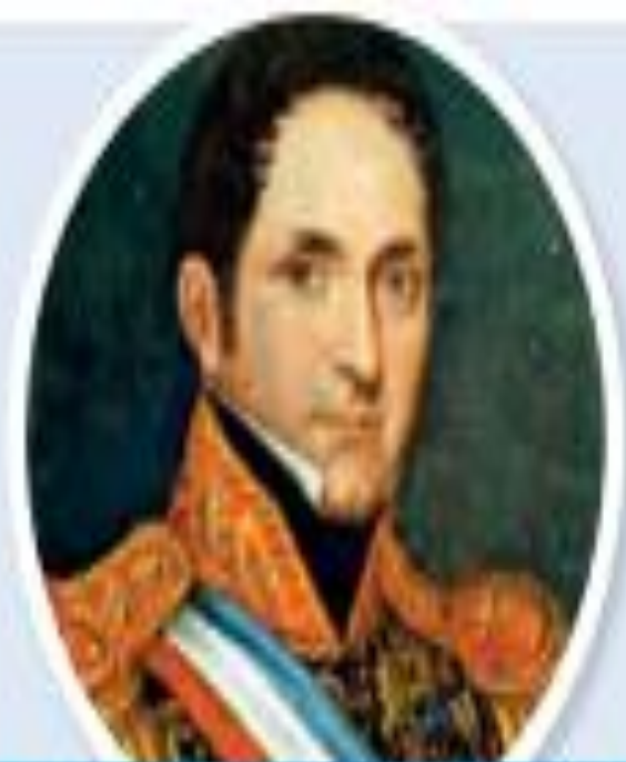
José Joaquín Prieto (1831-1841)

El periodo de gobiernos conservadores, también es conocido como la época de los decenios, esto por la extensión de 10 años de sus gobiernos