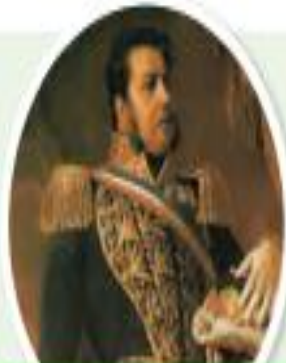
Manuel Bulnes (1841-1851)