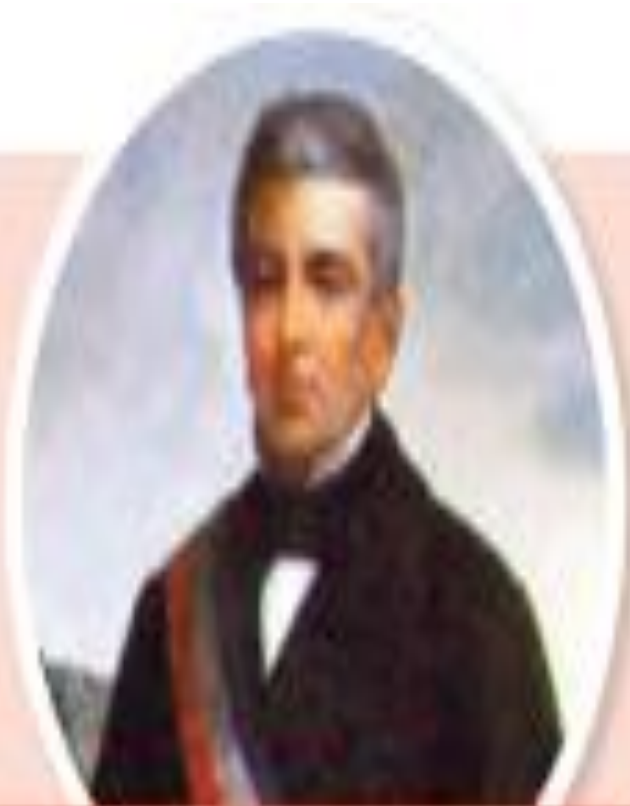
Manuel Montt (1851-1861)